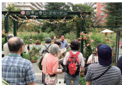
■四季の香ローズガーデン見学