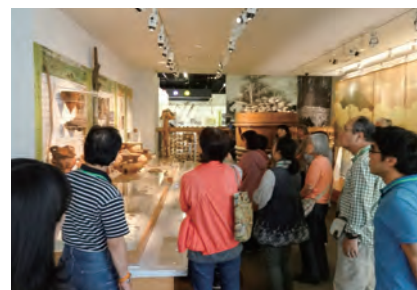
■石神井公園ふるさと文化館見学

※平成29年度講座詳細につきましては、練馬Enカレッジ受付窓口(平成29年3月31日までは ☎03-3904-4881、平成29年4月1日以降は ☎03-3991-1667)までお問い合わせください。